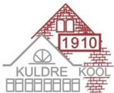
Joonis 1: Kuldre Kooli logo

Erinevat liiki lisadel on oma numeratsioon. Kõikidele illustratsioonidele tuleb teksti sees viidata.