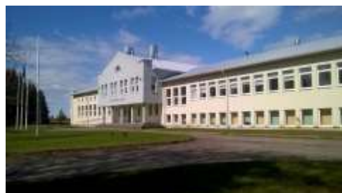
Foto 1: Kuldre Kooli koolihoone

2 näidet: Joonisel 1 kujutatud Kuldre kooli logol on kasutatud halli ja telliskivipruuni värvi erinevate majade kujutamisel. Fotol 1 olev Kuldre Kooli hoone keskel asuval peasissekäigul samasugune katus nagu logol oleval hoonel.