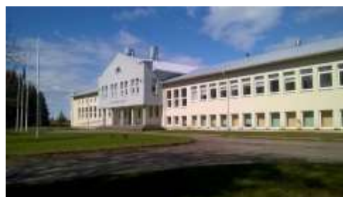
Foto 1: Kuldre Kooli koolihoone

2 näidet: Joonisel 1 kujutatud Kuldre kooli logol on kasutatud halli ja telliskivipruuni värvi erinevate majade kujutamisel. Fotel 1 olev Kuldre Kooli hoone keskel asuval peasissekäigul samasugune katus nagu logol oleval hoonel.